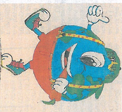
Un pianeta Terra che si nutre