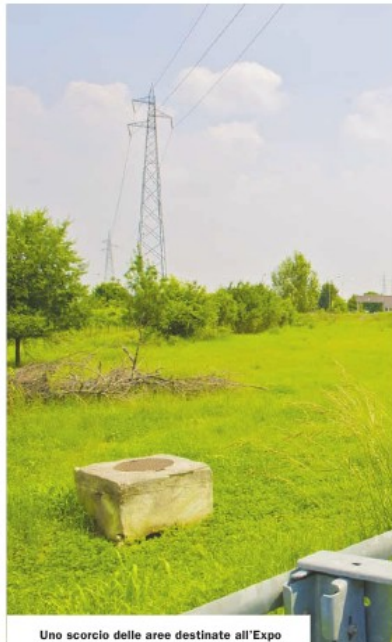
Uno scorcio delle aree destinate all'Expo

«Porterò avanti questo impegno nello spirito di condivisione e collegialità che ha sempre distinto il Patto dei Sindaci del Nord Ovest - ha dichiarato il neo presidente - Tutte le proposte, al di là dei territori di provenienza, saranno sostenute con identica forza su tutti i tavoli istituzionali. Spero di poter riconvocare a breve la conferenza perché Expo è ormai un treno in corsa e non c'è più tempo da perdere. Spero che Comune di Milano, Provincia di Milano, Regione Lombardia e società Expo 2015 diano il giusto peso alle iniziative territoriali che il Patto rappresenta».