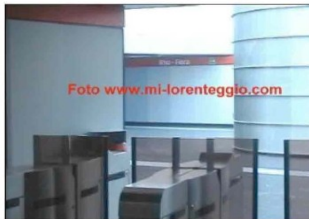
La MM a Rho-Fiera

L'armonizzazione delle tariffe è uno dei temi più importanti nell'ambito dei tavoli relativi ad EXPO 2015